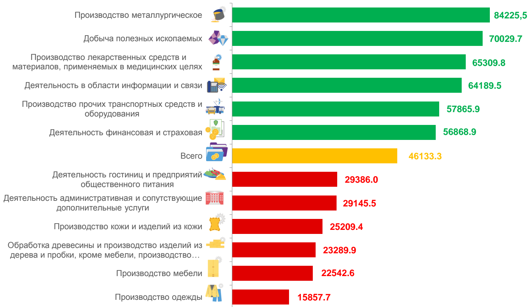
Распределение по видам экономической деятельности в апреле 2022 года

реальная начисленная заработная плата в % к маю 2021 года